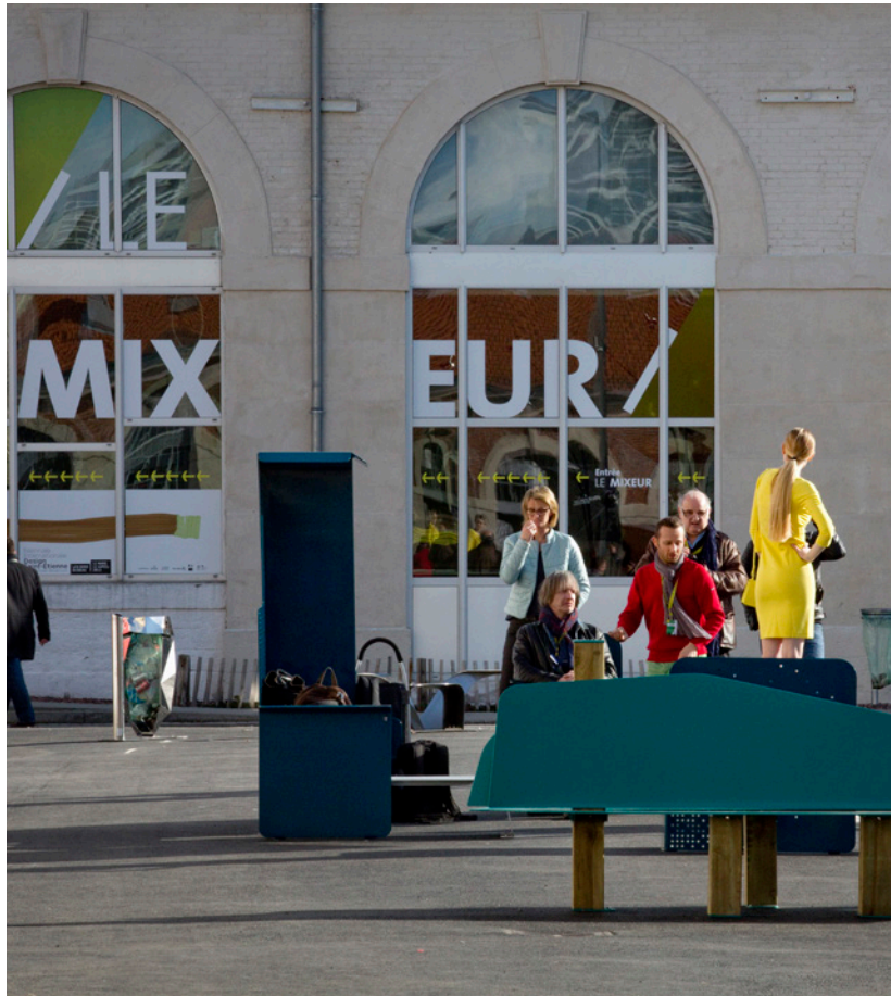
LA COURSIVE - THE PASSAGEWAY

In March 2017, the Biennale welcomed more than 230.000 visitors on the Manufacture/ Cité du Design main, but also in the numerous exhibitions programmed in the city and the region. This 10th edition on the theme "Working Promesse - Shifting Work Paradigms" welcomed delegations from 30 countries and more than 400 journalists, and invited the city of Detroit (USA) as the guest of honor.