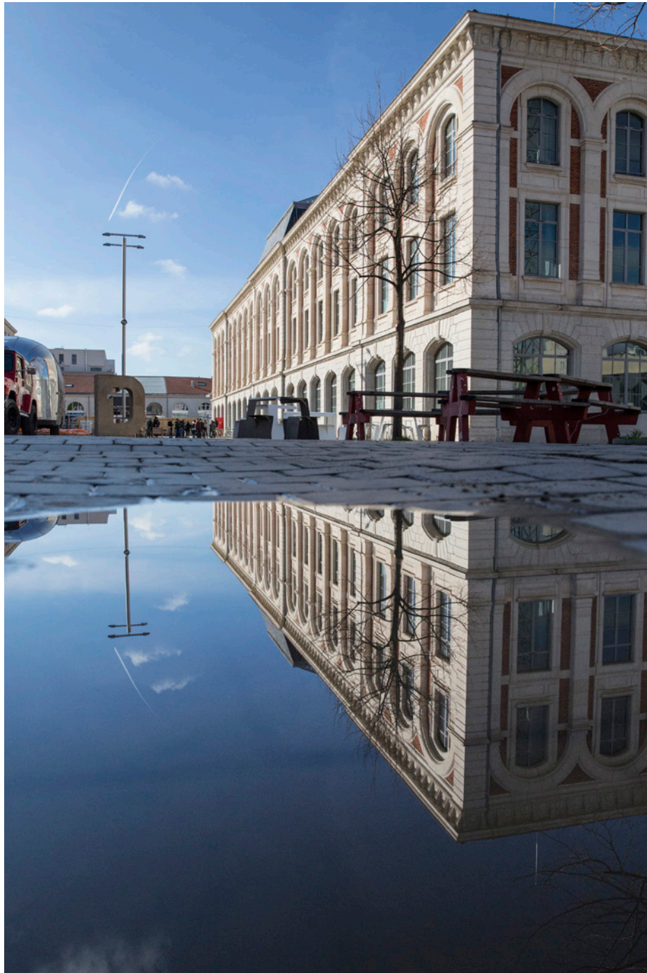
biennale 22 mars