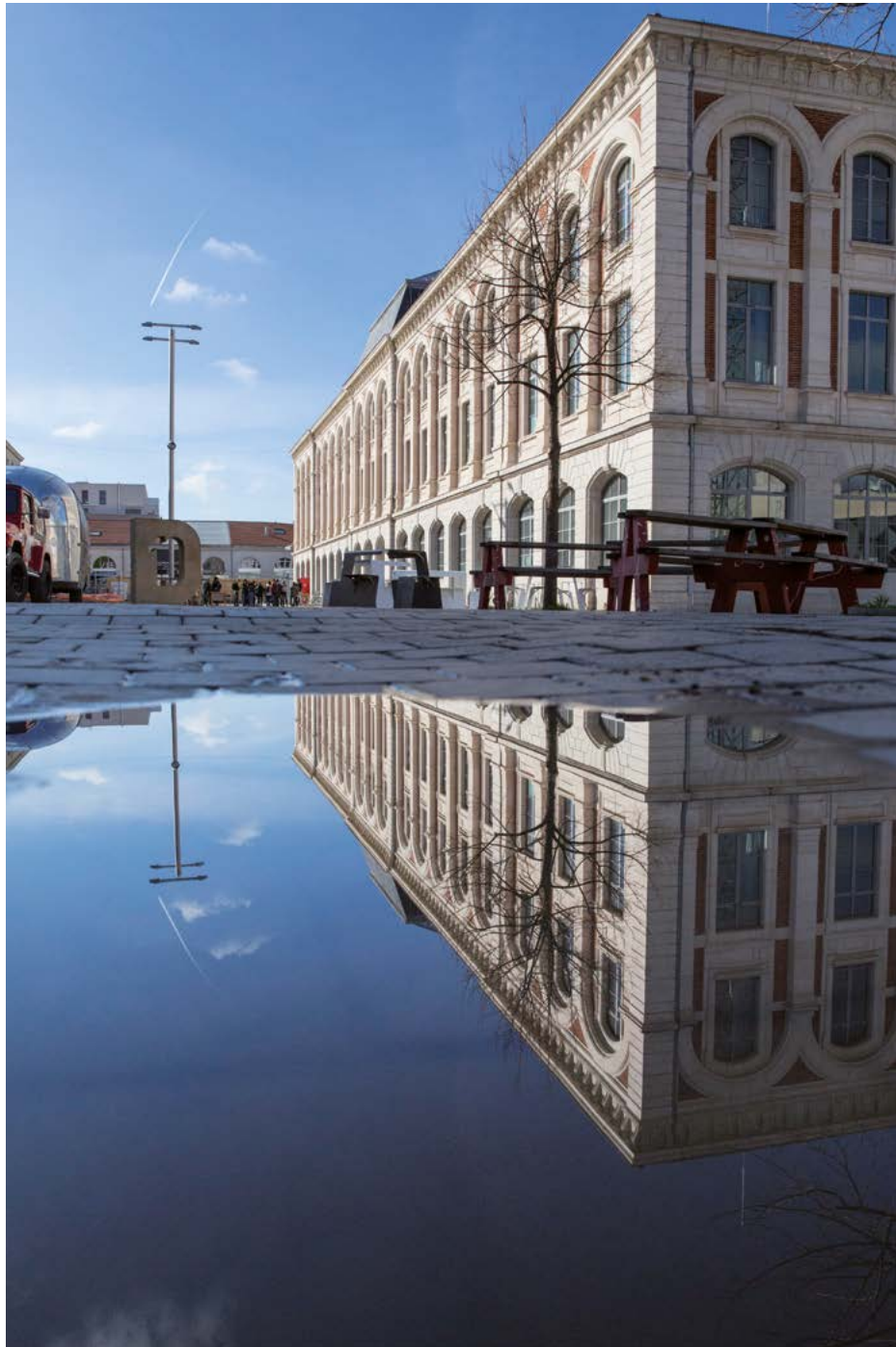
biennale 22 mars