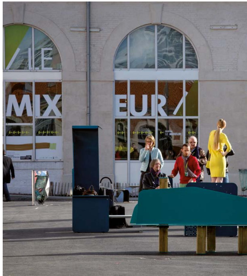
LA COURSIVE - THE PASSAGEWAY

In March 2017, the Biennale welcome more than 230,000 visitors on the Manufacture/ Cité du Design site, but also in the numerous exhibitions programmed in the city and the region. This 10th edition on the theme "Working Promesse - Shifting Work Paradigms" welcome delegations from 30 countries and more than 400 journalists, and invited the city of Detroit (USA) as the guest of honor.